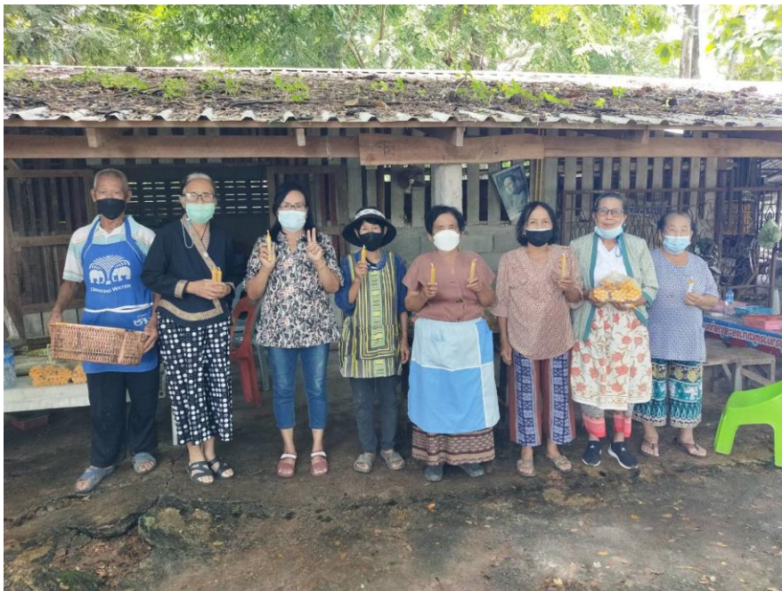
กลุ่มทำเทียนผู้สูงอายุบ้านพระนั่งดิน

เดิมทีกลุ่มทำเทียนผู้สูงอายุบ้านพระนั่งดิน สามารถสร้างรายได้ประมาณ ๓๐๐,๐๐๐ บาทต่อเดือน ให้ผู้สูงอายุในกลุ่ม โดยแบ่งปันส่วนให้กับทางวัดและชาวบ้านที่ดูแลการจำหน่าย แต่เนื่องจากสถานการณ์การระบาดของโรคโควิด 2019 ทำให้ทางกลุ่มฯช่วงนี้มีรายได้ที่ลดลง