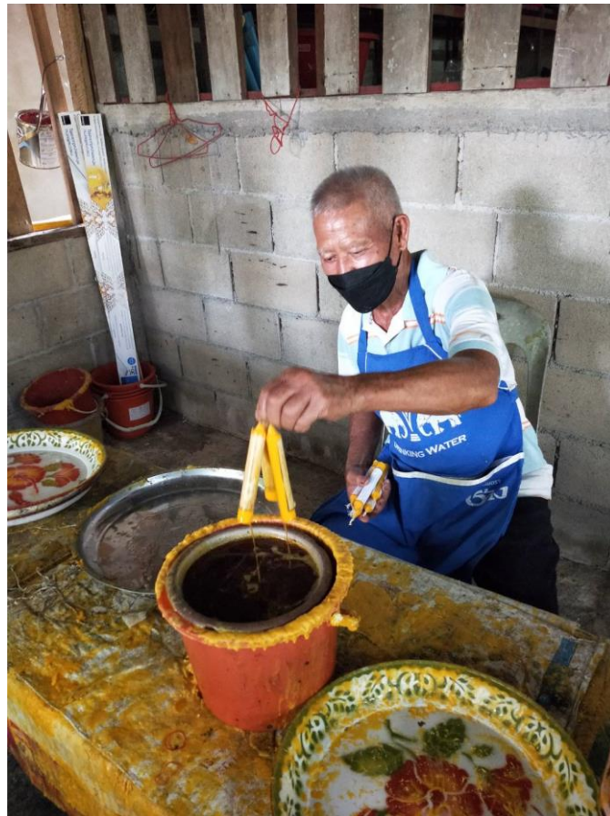
นำเทียนและแผ่นยันต์ไปชุบอีกครั้ง