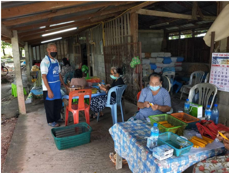
ใส่แผ่นยันต์สะเดาะเคราะห์ เสริมดวงชะตา ยึดตามแบบภูมิปัญญาที่สืบทอดกันมา