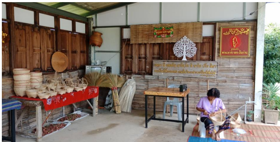
ภายในบริเวณสวนมีการทำเครื่องจักสารจากไม้ไผ่