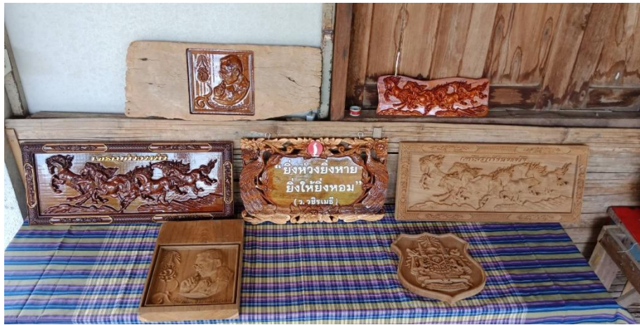
ชิ้นงานแกะสลัก และงานป้าย จากไม้มงคล