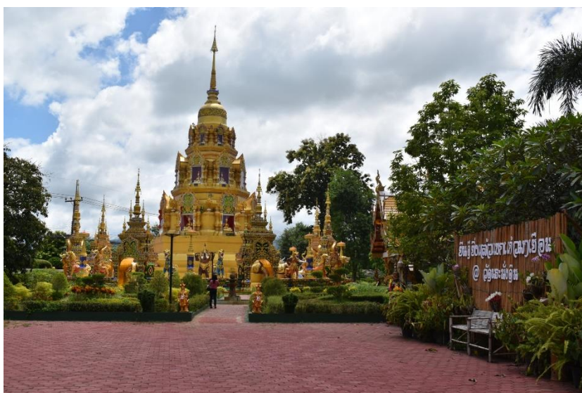
บรรยากาศภายในวัด