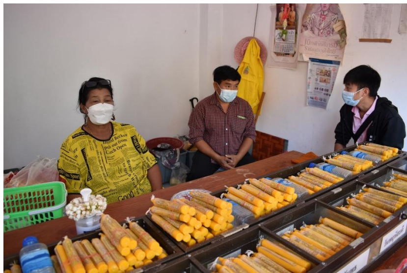
จุดวางจำหน่าย ตั้งอยู่ภายในบริเวณวัดพระนั่งดิน อำเภอเชียงคำ