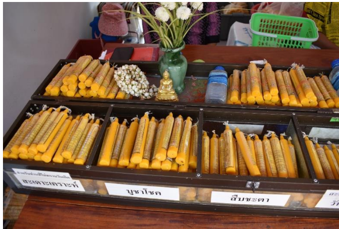
ผลิตภัณฑ์เทียนบุชารูปแบบต่างๆ ตามความเชื่อ