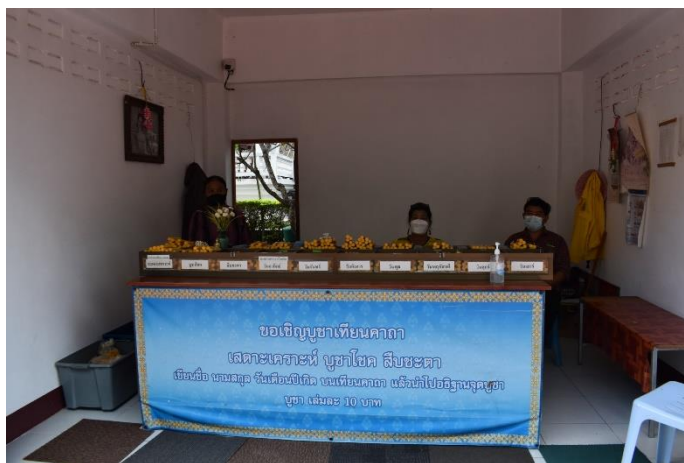
ร้านค้าของกลุ่มทำเทียนผู้สูงอายุบ้านพระนั่งดิน