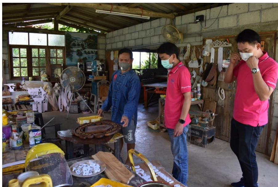
ปัจจุบันได้มีการพัฒนา ใช้เครื่องตัด CNC และคอมพิวเตอร์ ในการผลิตชิ้นงาน